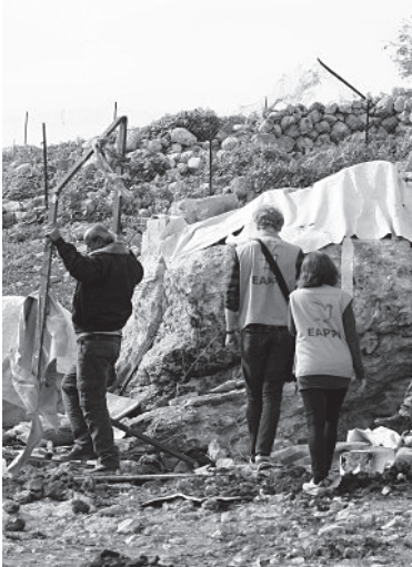
EAPPI-BeobachterInnen in Khirbet Tana.